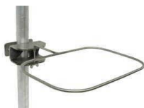
Support Chariot fil inox