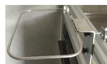
Support équerre avec système d'accroche horizontal et vertical (E+ / Maxi)