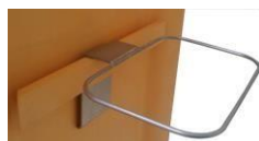
Support équerre pour chariot modulaire (E+ / Maxi)