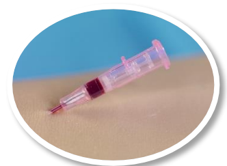
Technologie Blood Control